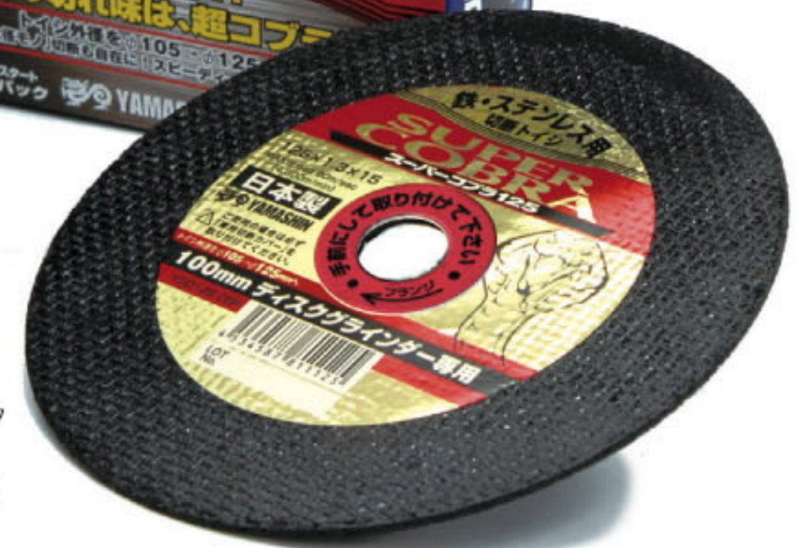
■専用切断カバー付 スタートパック 品番:YSD125CBF P1 JANコード:4534587 811149

ディスク外径を φ105→φ125ミリへ 新開発「αV」特殊樹脂で実現! 「大径モノ」切断も自在に! スピーディーに一発でカット!