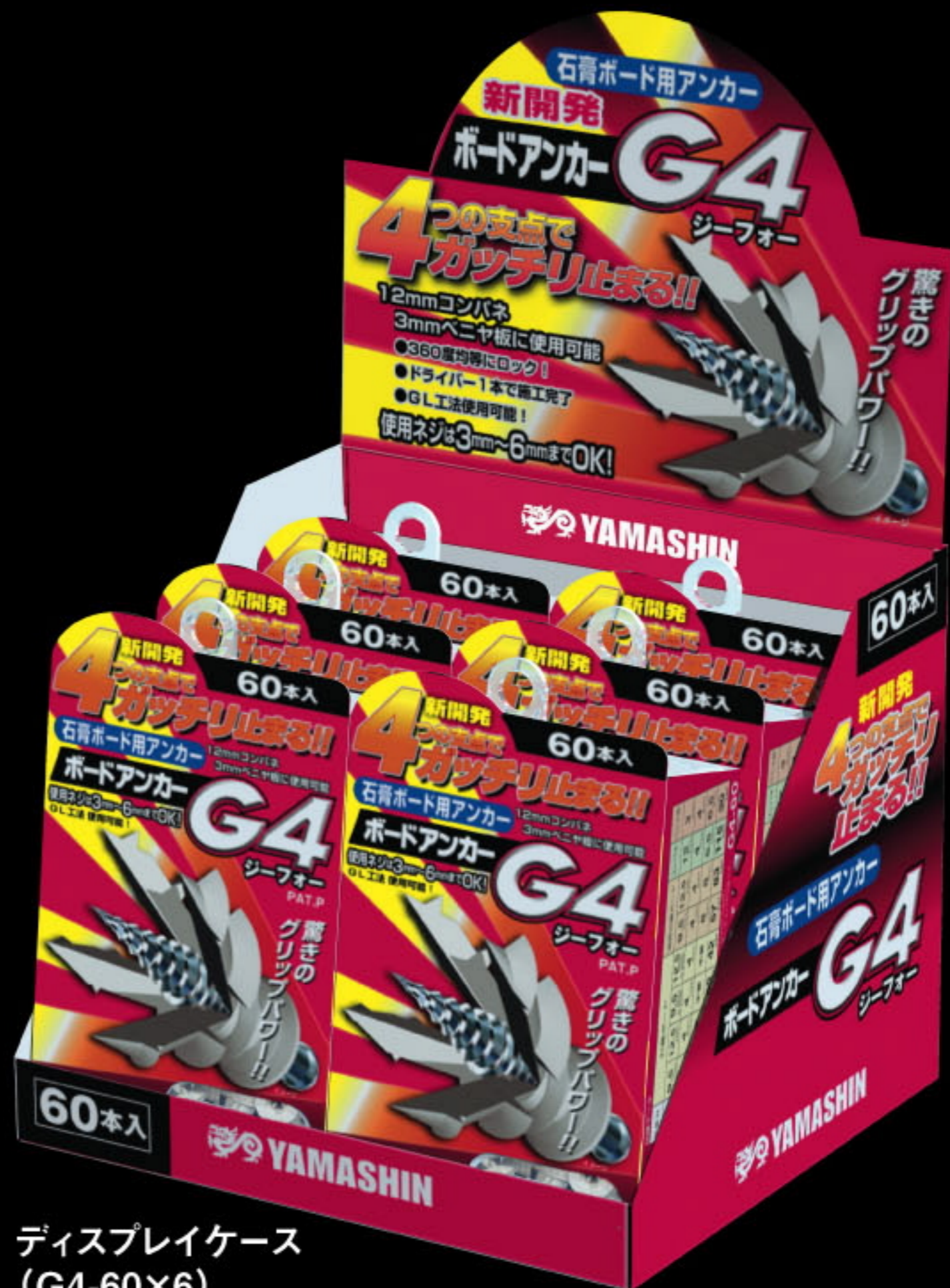
ディスプレイケース (G4-60×6)