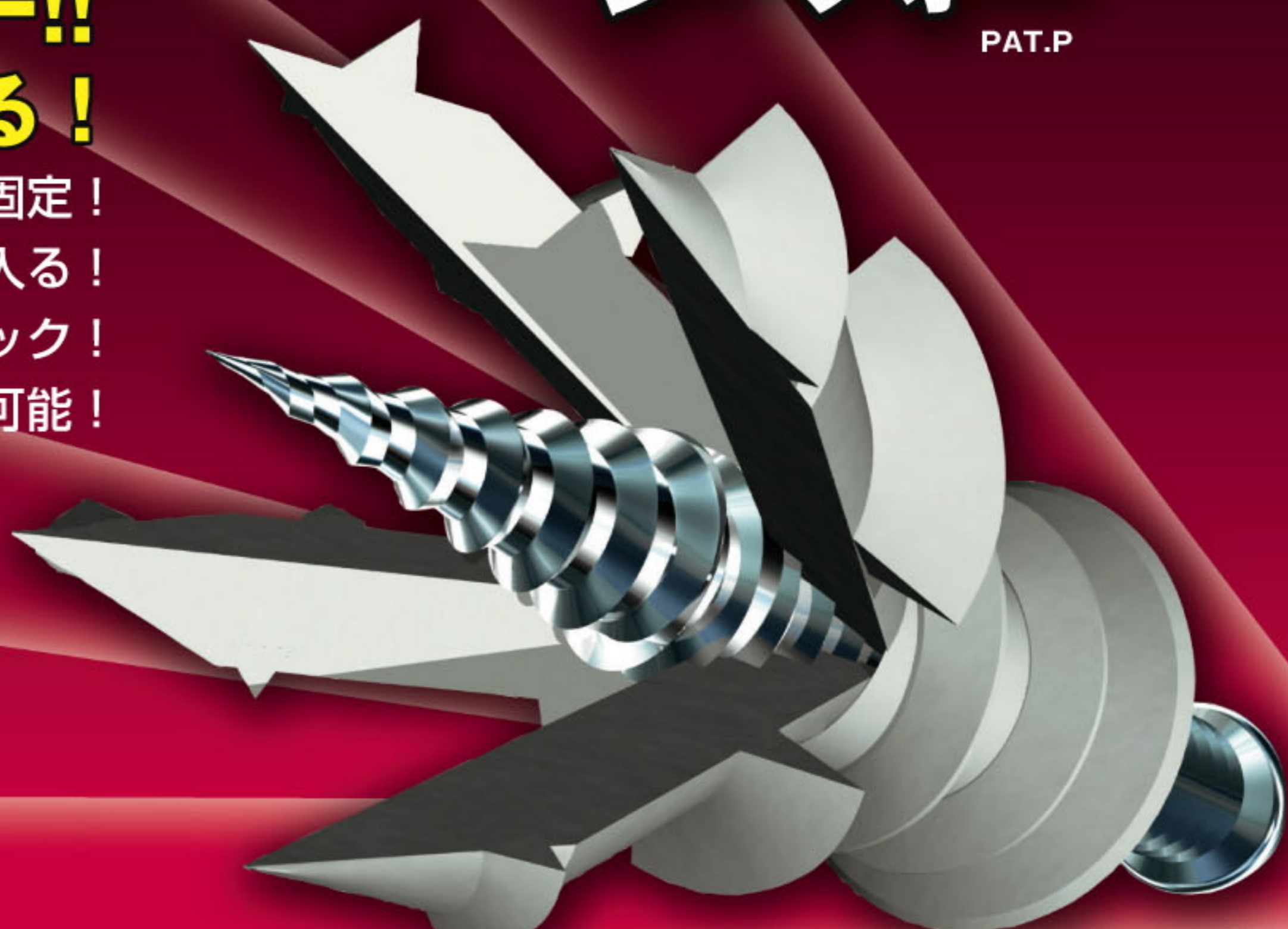
イメージイラスト

先端がカベの中で4つに割れて、ガッチリ固定! 取付ネジが、アンカーのセンターにまっすぐ入る! 360度均等にロック! GL工法使用可能!