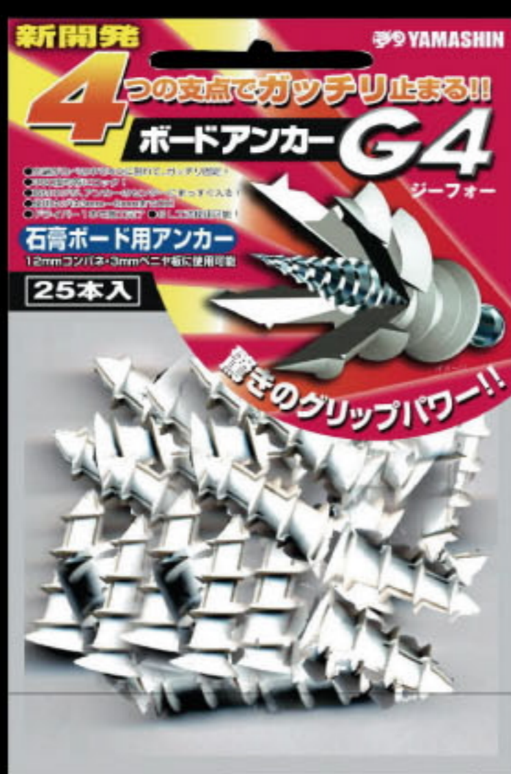
G4-25 ボードアンカー-G4/25本入