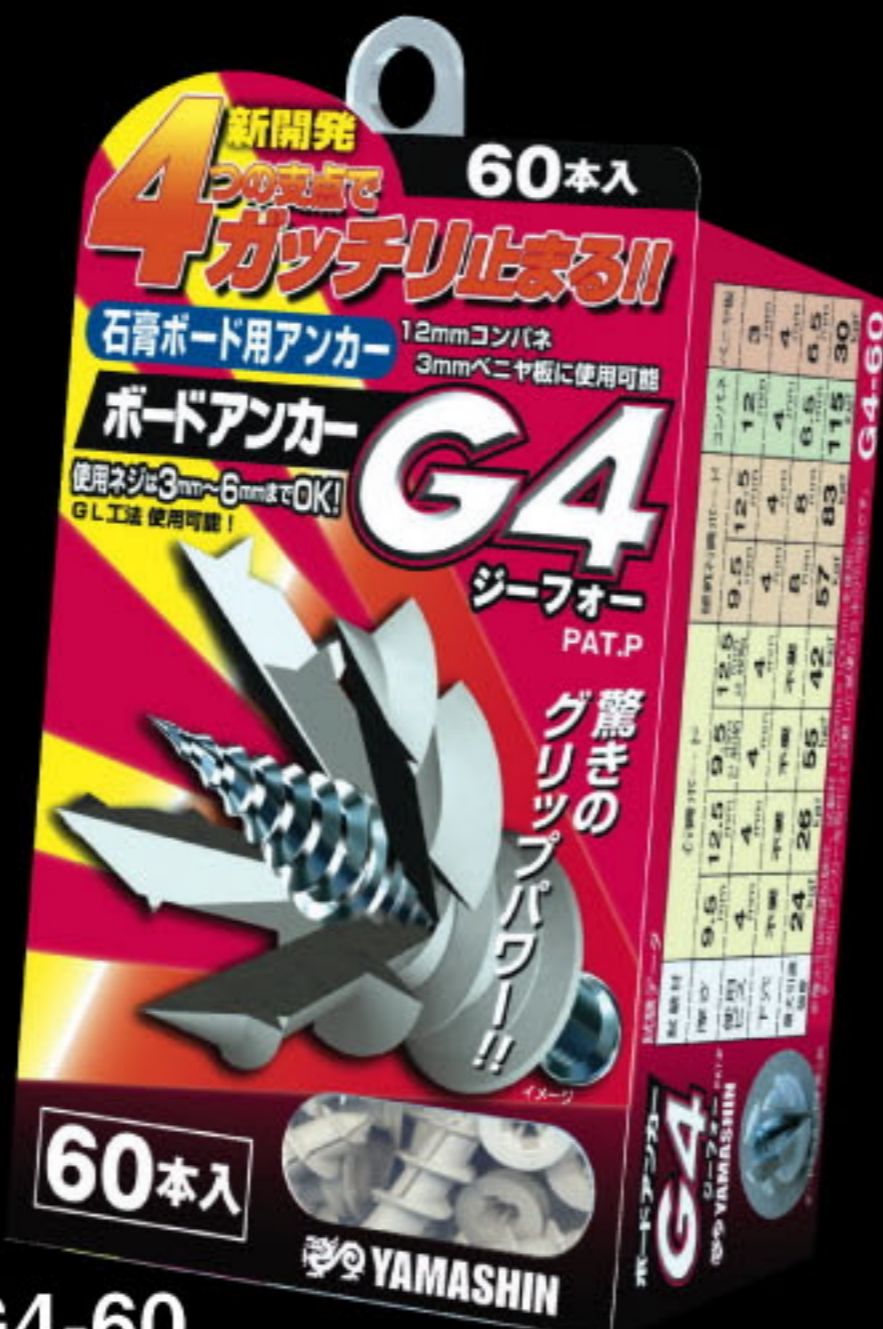
G4-60 ボードアンカー-G4/60本入